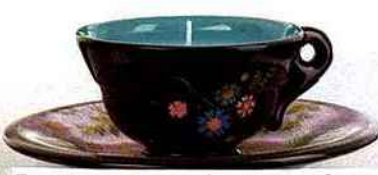
Tasse et soucoupe en céramique avec bougie, 2 parfums au choix (thé des tsars ou thé matriochka), 31 €, Bougies la Française.