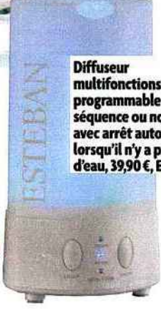
Diffuseur multifonctions programmable par séquence ou non-stop avec arrêt automatique lorsqu'il n'y a plus d'eau, 39,90 €, Esteban.