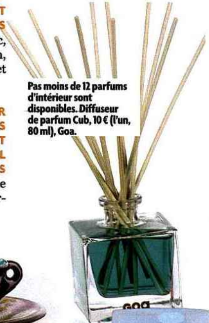
Pas moins de 12 parfums d'intérieur sont disponibles. Diffuseur de parfum Cub, 10 € (l'un, 80 ml), Goa.

15 VOUS AIMERIEZ QUE VOS ARMOIRES DÉGAGENT UNE BONNE ODEUR À L'OUVERTURE Posez à chaque étage une coupelle remplie de sels de bain qui diffuseront un parfum agréable. Sans oublier bien évidemment le truc de nos grands-mères : le petit sachet en étamine empli de lavande séchée. ■