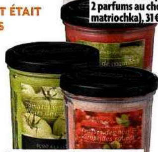
Bougies aux parfums de confiture (fraises des bois et groseilles rouges, tomates vertes aux fleurs de capucines...), 17,50 €, Point à la ligne.