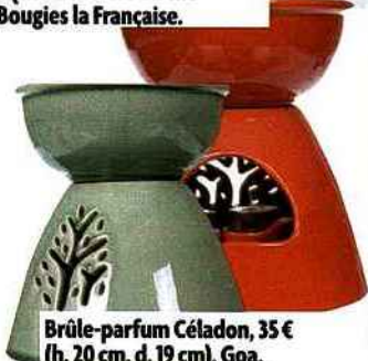
Brûle-parfum Céladon, 35 € (h. 20 cm, d. 19 cm), Goa.