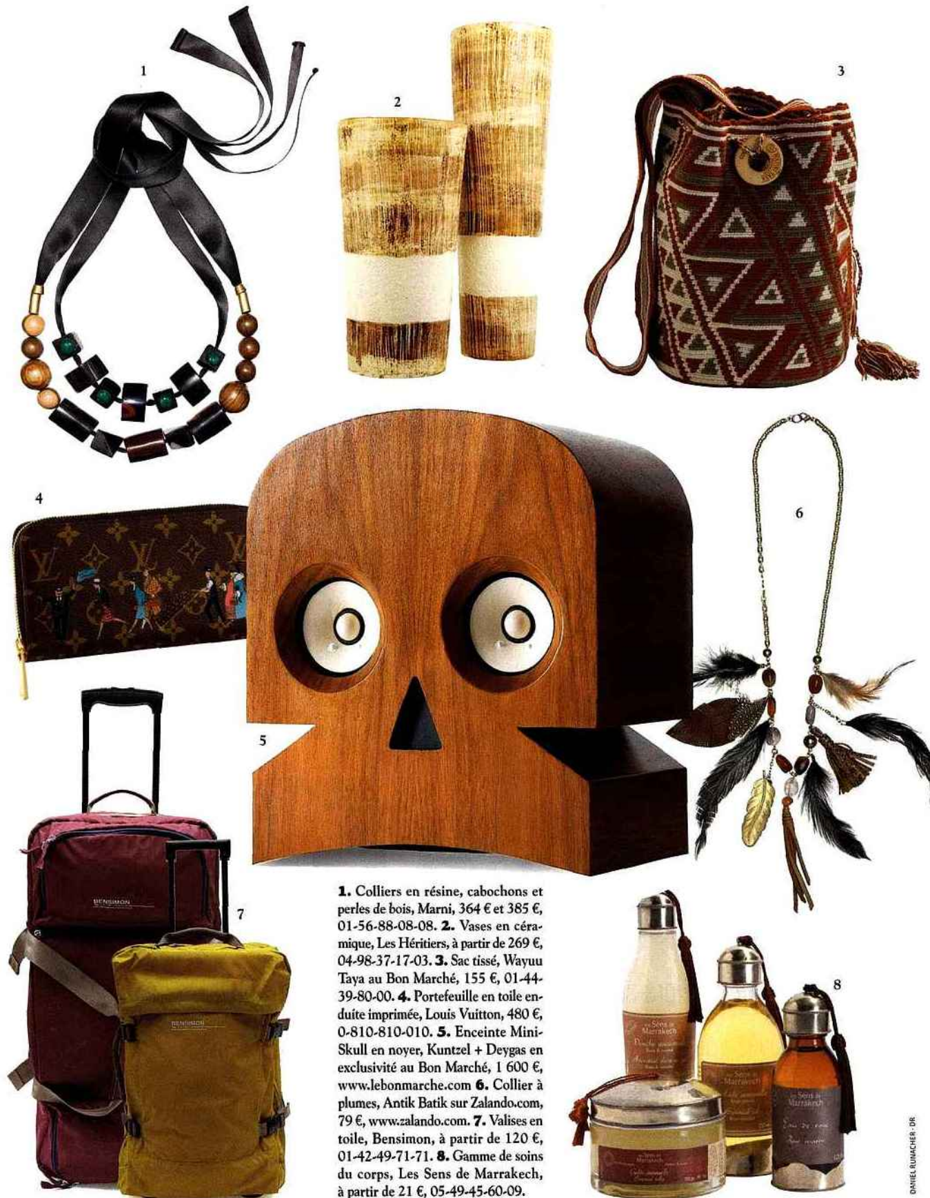
1. Colliers en résine, cabochons et perles de bois, Marni, 364 € et 385 €, 01-56-88-08-08. 2. Vases en céramique, Les Héritiers, à partir de 269 €, 04-98-37-17-03. 3. Sac tissé, Wayuu Taya au Bon Marché, 155 €, 01-44-39-80-00. 4. Portefeuille en toile enduite imprimée, Louis Vuitton, 480 €, 0-810-810-010. 5. Enceinte Mini-Skull en noyer, Kuntzel + Deygas en exclusivité au Bon Marché, 1 600 €, www.lebonmarche.com 6. Collier à plumes, Antik Batik sur Zalando.com, 79 €, www.zalando.com. 7. Valises en toile, Bensimon, à partir de 120 €, 01-42-49-71-71. 8. Gamme de soins du corps, Les Sens de Marrakech, à partir de 21 €, 05-49-45-60-09.