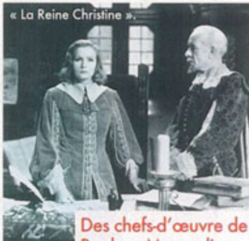
« La Reine Christine ».

Comme nombre d'enfants nés de parents arméniens contraints à l'exil, Antoine Agoudjian a d'abord été fasciné par la danse. On retrouve cette obsession dans nombre de ses photographies, qu'elles concernent les Restos du cœur, un tremblement de terre en Arménie, le blocus d'Erevan durant la guerre avec l'Azerbaïdjan, ou le sort des réfugiés du Moyen-Orient. Ses images sont exposées au Jardin des Arts à Septèmes-Les-Vallons, près de Marseille, jusqu'au 28 avril.