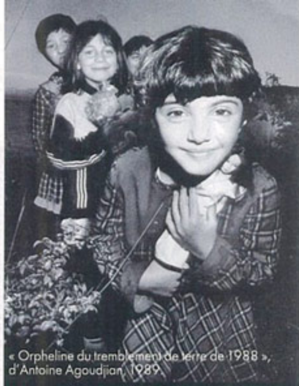
« Orpheline du tremblement de terre de 1988 », d'Antoine Agoudjian, 1989.

■ « Armenia Sacra » et « Sarkis », au musée du Louvre, jusqu'au 21 mai. A voir aussi l'installation Sarkis au Musée Bourdelle, jusqu'au 3 juin.