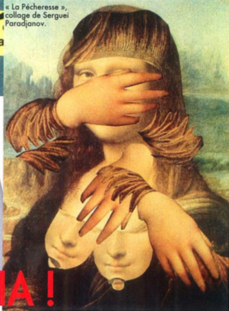
« La Pécheresse », collage de Serguei Paradjianov.

vertes. Rien n'est laissé de côté, ni la récurrente question de la reconnaissance du génocide perpétré par les Turcs en 1915, ni l'apport de l'Arménie à la tradition chrétienne en Orient, ni les dynasties de voyageurs qui essaimèrent en Afrique, en Asie, ni l'influence des créateurs venus d'Arménie dans les secteurs de l'art et de la mode. Alors, dans ce tohu-bohu événementiel, que choisir ? Voici une petite sélection de « l'arménian way of life », revue et corrigée par les artistes, les cinéastes, les couturiers, les épiciers aussi... bref, tous ceux dont l'inspiration trouve une part de son souffle du côté d'Erevan.