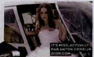
IT'S MISS, ACTUALLY BY ANTON CORBIJN DIOR.COM

peau. Les pigments encapsulés de cette formule grise se libèrent à l'application pour corriger le teint. Le SPF50 met la peau sous cloche. Protégée, elle cicatrise et se régénère mieux, se repulpe et s'éclaircit, rougeurs et imperfections sont floutées. Sa texture dense se masse et apaise les irritations.