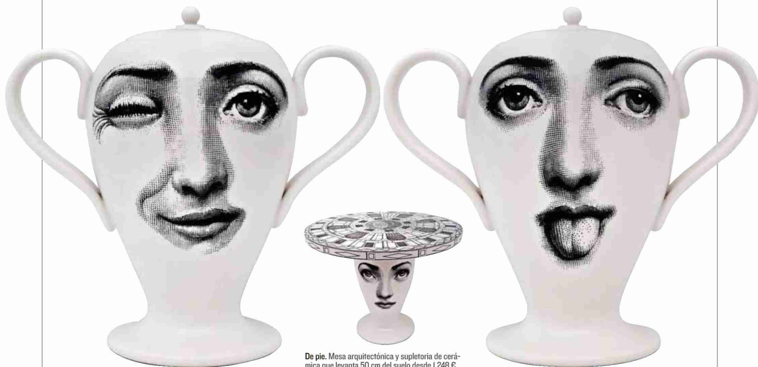
De pie. Mesa arquitectónica y supletoria de cerámica que levanta 50 cm del suelo desde 1.248 €.

GUIÑO A FORNASETTI. La familia crece. Las variaciones de los enigmáticos rostros de Piero Fornasetti son motivo para una colección de jarrones a cargo de la firma de cerámica Bitossi. Todos proceden de un