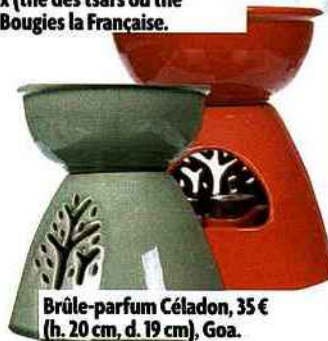
Brûle-parfum Céladon, 35 € (h. 20 cm, d. 19 cm), Goa.