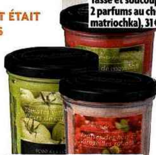
Bougies aux parfums de confiture (fraises des bois et groseilles rouges, tomates vertes aux fleurs de capucines...), 17,50 €, Point à la ligne.