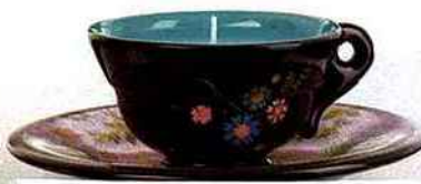
Tasse et soucoupe en céramique avec bougie, 2 parfums au choix (thé des tsars ou thé matriochka), 31 €, Bougies la Française.