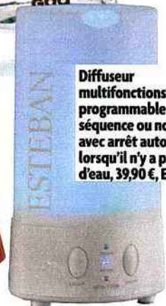
Diffuseur multifonctions programmable par séquence ou non-stop avec arrêt automatique lorsqu'il n'y a plus d'eau, 39,90 €, Esteban.