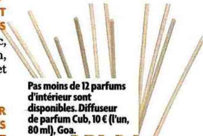
Pas moins de 12 parfums d'intérieur sont disponibles. Diffuseur de parfum Cub, 10 € (l'un, 80 ml), Goa.

15 VOUS AIMERIEZ QUE VOS ARMOIRES DÉGAGENT UNE BONNE ODEUR À L'OUVERTURE Posez à chaque étage une coupelle remplie de sels de bain qui diffuseront un parfum agréable. Sans oublier bien évidemment le truc de nos grands-mères : le petit sachet en étamine empli de lavande séchée. ■