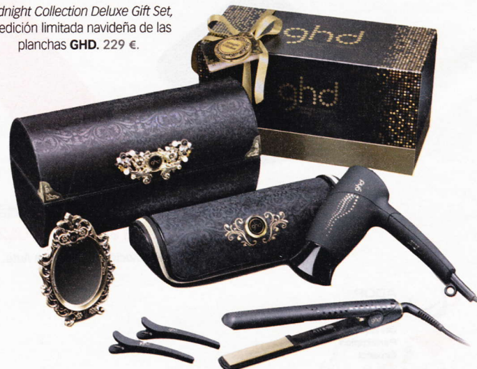
Midnight Collection Deluxe Gift Set , la edición limitada navideña de las planchas GHD . 229 €.