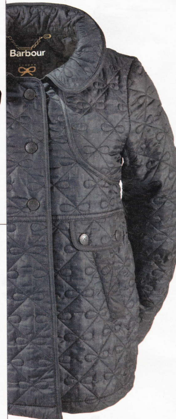
Se llama Minx y es un diseño de Anya Hindmarch para Barbour . 399 €.