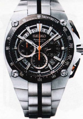
Cronógrafo masculino de la colección Sportura . Seiko . 2.600 €.