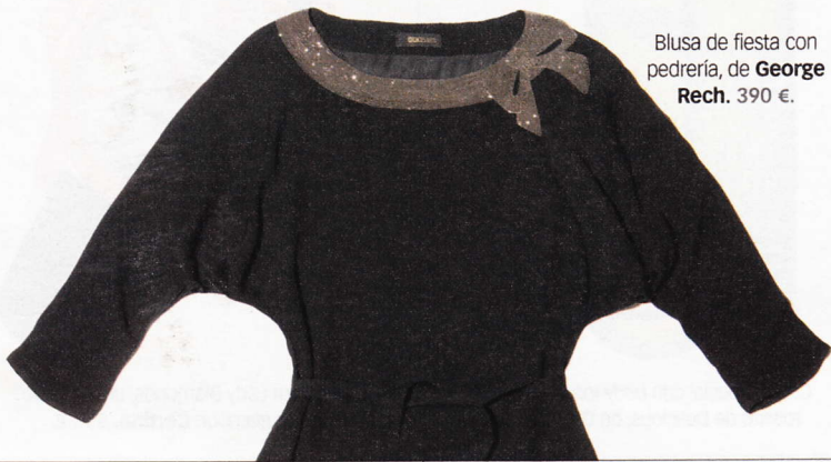
Blusa de fiesta con pedrería, de George Rech . 390 €.