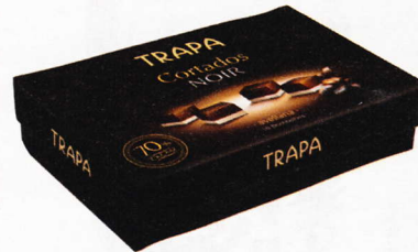
Delicias irresistibles de chocolate negro. Cortados noir , de Trapa . c.p.v.