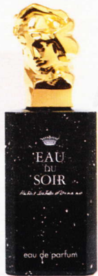
Inspirada en la obra de Anish Kapoor, edición limitada de Eau de Soir . Sisley . 197 €.