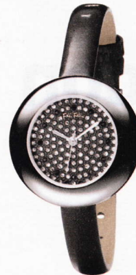
De la colección Minimalistic , reloj con manillas luminosas. Folli Folie . 160 €.