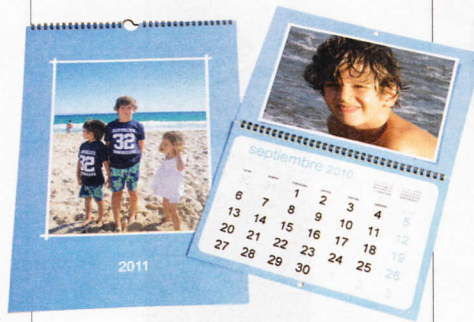
Calendarios personalizables con tus fotos favoritas. Son de Fann . 15,90 €.