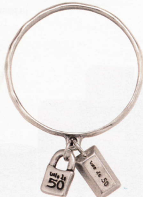
Pulsera de la suerte con charms. Hay cuatro distintas. De Uno de 50 . 45 €.