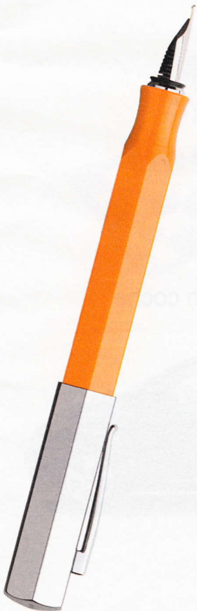
Pluma con cuerpo de resina, de la línea Ondoro , de Faber-Castell . 98 €.