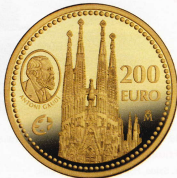
Moneda de oro para coleccionistas, dedicada a Antonio Gaudí. FNMT . 610 €.